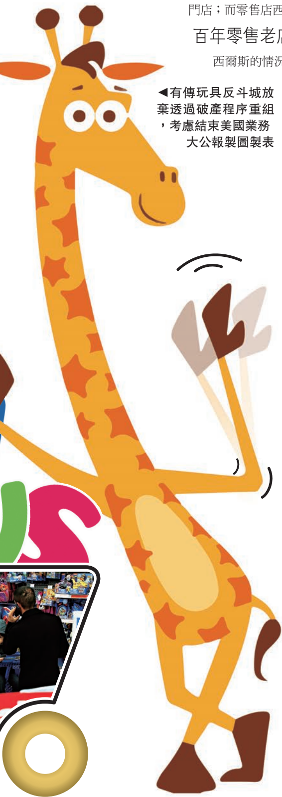
◀有傳玩具反斗城放棄透過破產程序重組，考慮結束美國業務 大公報製圖製表

美泰和孩之寶估計，由於受到玩具反斗城申請破產的影響，兩間公司的假期旺季銷售受到拖累。彭博及路透均有引述消息報道，玩具反斗城至今尚未找到買家，或與債權人達成重組債務協議，指該公司考慮結束其美國業務。