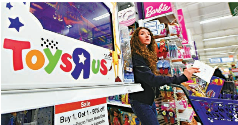
◀若玩具反斗城結束美國業務，玩具製造商將受到負面影響

玩具反斗城在配合債權人重組債務過程中，近期宣布關閉184間門店，約佔其800間美國門店約20%。外媒引述消息人士稱，該公司正在評估報價，打算將其餘的美國門店清盤，可能短期內會有公布，屆時有關各方將會參加破產聽證會。消息人士稱，玩具反斗城是否決定清盤，將會視乎清盤官的報價。 其中一位消息人士對外媒透露，玩具反斗城關閉美國門店及結束美國業務尚未有定案，這會是其一個選擇，部分債權人希望玩具反斗城可以找到買家，繼續營運，或者爭取債權銀行同意債務重整方案。玩具反斗城原本寄望聖誕節及新年的重要購物旺季，可以有強勁銷情，但事與願違，該假期旺季銷售未如預期，玩具反斗城能否繼續生存令人質疑。玩具反斗城