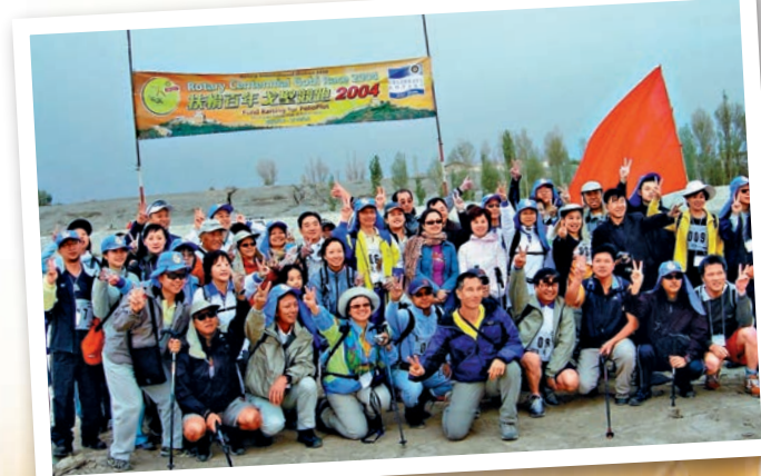
▲敦煌山莊和美國賽車之星於2004年成功合辦「戈壁長征Gobi March」180公里戈壁徒步挑戰賽

日出之前，騎乘駱駝從敦煌山莊出發，穿越約四十分鐘的沙漠戈壁，到達鳴沙山環繞的露天早餐場地。那裏地勢平坦，視野開闊。伴隨日出美景，在陽光中，和世界一起甦醒的還有我們的身體，細細品嚐早餐，吃進去的與其說是酒店的豐盛食物，不如說是大自然慷慨的饋贈。