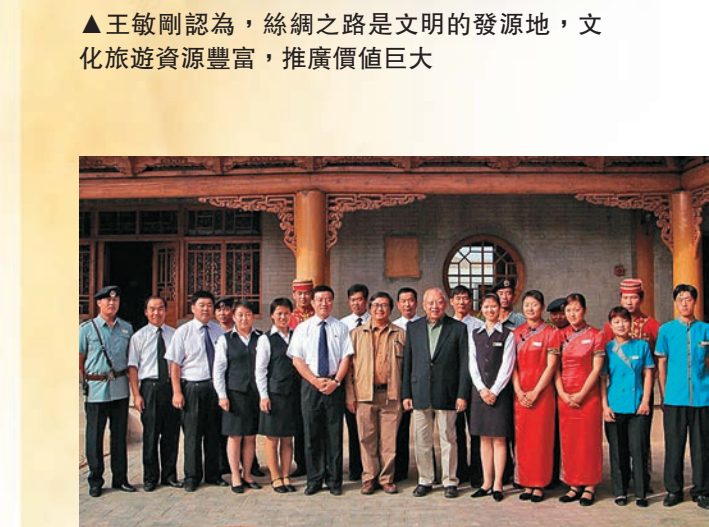
▲董建華2005年到訪敦煌山莊

不過，他們也不容易，我記得剛開業後我也去過一次，住的人很少，生意很不好，主要那時大家多數也不了解，特別是那時人們對那種風格也沒有什麼認識，可能覺得看上去不夠現代。所以有些人覺得裝修成那樣是為了省錢，但那是他們不了解，真正進去看過、住過的人是知道的，那些裝修其實不會少用錢的，木柱、木窗、木樑、木櫃、木椅、木桌不僅都真材實料，而且都做得很講究。