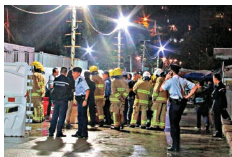
▲北角碼頭旁建築地盤發生奪命火，事後大批警員及消防員到場調查

【大公報訊】記者張琦報道：北角碼頭旁一個建築地盤昨晚有貨櫃辦公室發生火警，其間傳出爆炸聲響，消防員接報到場，開喉向貨櫃射水灌救。一名女子在火場內被發現嚴重燒傷，由救護員送院搶救後證實不治，消防及警方正就起火原因展開調查。