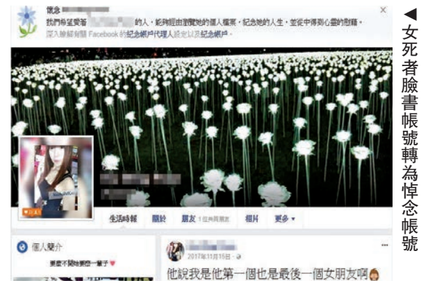
▲女死者臉書帳號轉為悼念帳號