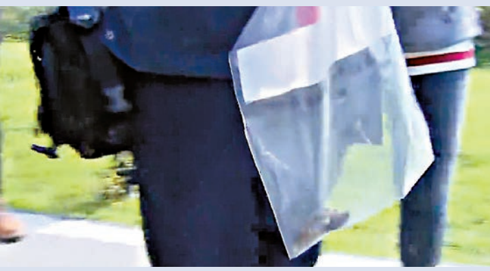
▲台警在棄屍現場檢獲懷疑人骨