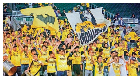
▲柏雷素爾球迷全場不停打氣，非常落力

特意從日本專程來港支持。他們全程站立，且不停地大唱為柏雷素爾助威的歌曲，整齊劃一，甚有氣勢。同時有數名鼓手敲打大鼓，甚至有旗手揮舞自製的旗子打氣，增加了比賽氣氛。 大公報記者張銳