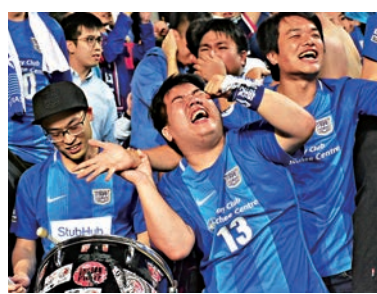
▲傑志獲勝後球迷忘形慶祝

亞冠杯是亞洲區內最高水平的洲際賽事，港超球隊自從上賽季獲得賽事正賽後，每逢亞冠杯比賽日都會吸引本地球迷的關注。昨仗約有七千多名球迷湧入香港大球場觀賽。由於球迷數量眾多，因此警方特意增派人手在通往大球場的禮頓道和加路連山道等道路實施人流和交通管制措施，維持秩序，確保球迷順利到達球場。而傑志球迷在場內亦落力為愛隊打氣，絲毫不遜色於柏雷素爾的擁躉，最後傑志取勝，球迷都十分興奮和激動，可謂乘興而歸。