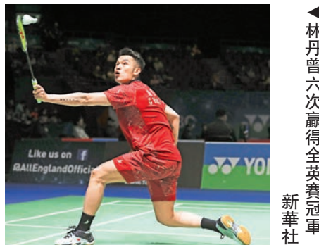
▲林丹曾六次贏得全英賽冠軍

國家隊三個雙打項目按照奪冠機率排序，大概是混雙、女雙和男雙。去年，混雙拿到國羽全英唯一一金。此前國羽遵循不兼項原則重組，鄭思維、黃雅瓊搭檔後連奪三站冠軍，今年只輸了一場。女雙從2001年至2015年，只有2008年冠軍旁落，之後連丟兩年冠軍後，去年陳清晨、賈一凡奪得世界錦標賽冠軍，女雙逐漸有了起色。男雙同樣奪得去年世錦賽冠軍，但全英最近奪冠則在五年前。選手間水準相近，臨場發揮才是關鍵。