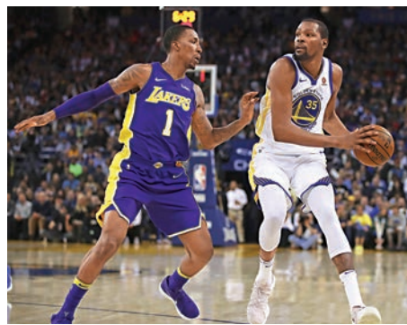
▲杜蘭特（右）助勇士報捷