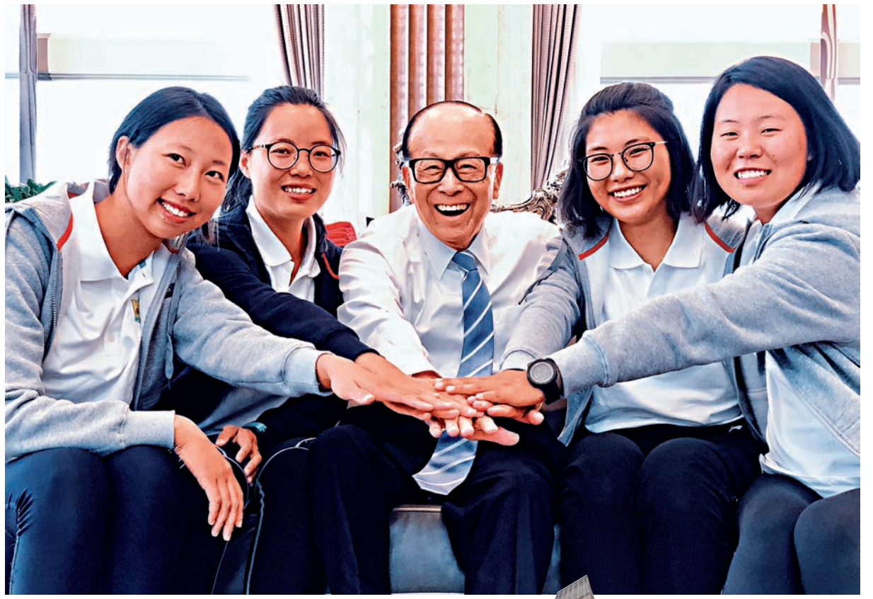
▲汕頭大學划艇隊「功夫茶茶」於一月橫渡大西洋，創下四項世界紀錄。李嘉誠十分欣賞四名女生的勇氣和毅力，鼓勵她們做「激勵大使」，多與年輕朋友分享正能量。

「當時是戰後不久，（那個時代）有好多機會，今日的年輕人亦一樣有好多機會！」年紀小小已被迫休學，卻堅持看《辭海》自修的他，即使事業有成，亦從未停止學習。李嘉誠深信「知識改變命運」，勉勵年輕人要增強自我競爭能力，包括要求知、增強自己、學習新科技及技術。