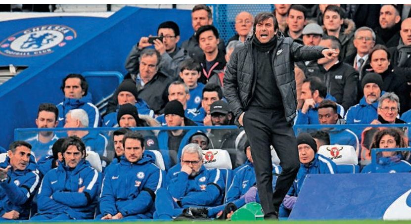
干地（前）帶領的車路士，剛於歐聯出局 資料圖片