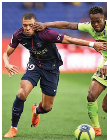
基利安麥巴比（左）是巴黎聖日耳門的攻擊重心

德里或重返巴塞隆拿的消息。不過，聖日耳門陣中仍有法國新星基利安麥巴比，他近期表現漸入佳境，周中聯賽更個人「梅開二度」，此戰會繼續扮演球隊的攻擊重心。