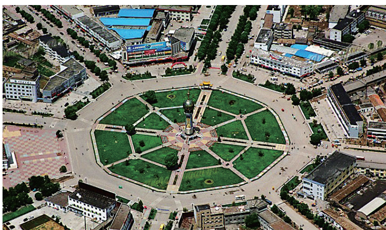
▲按八卦圖設計的特克斯縣城