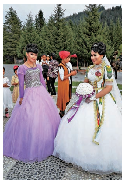
▲漂亮的維吾爾族新娘和伴娘