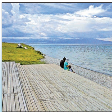
▲在賽里木湖畔看風雲變幻