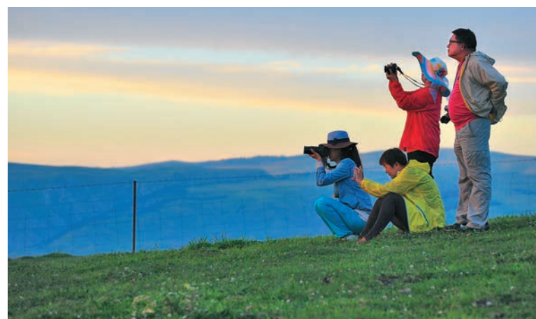
▲草原上一群早起的拍友

特克斯八卦城最早出現在南宋時期，相傳道教全真七子之一、龍門派教主「長春真人」邱處機雲遊西天山時，被此地的罡氣、川之柔順和水之盛脈所動，在此點穴，以八卦城的風水核心，確定了坎北、離南、震東、兌西四個方位，造就了特克斯八卦城最原始的雛形。