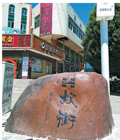
▲八卦城的街道以八卦方位命名