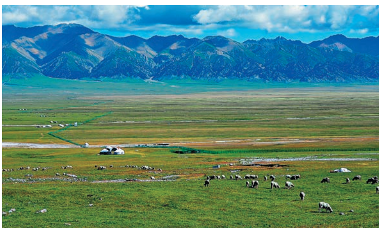
▲一望無際的草原牧場