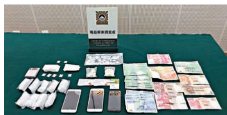
▲澳門司警展示檢獲約值19萬懷疑可卡因毒品及手提電話現金等證物

截獲一名來澳已有一個月18歲香港青年，在他的身上和租住在新口岸區的酒店房間，檢獲48小包共重16.21克懷疑可卡因。