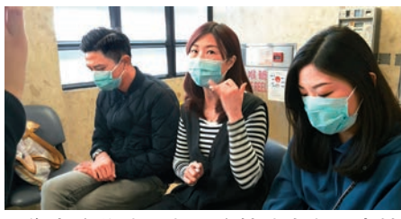
▲傷者胞弟（左）、胞姊（中）及表妹（右）到醫院了解最新情況

另外，杜父表示，涉事司機事後無聯絡過他們，又不配合警方調查「即使但而家道歉，我哋係唔會接受」。昨日有一條