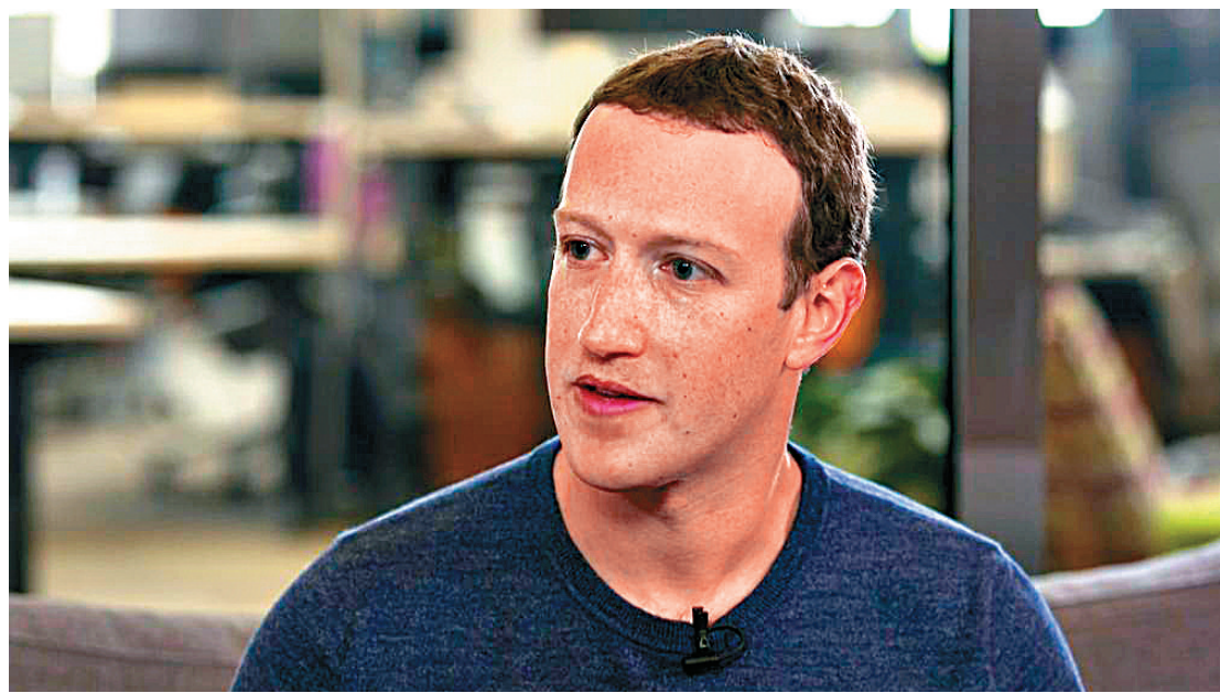
◀朱克伯格21日接受CNN專訪作出道歉

【大公報訊】綜合法新社、美聯社及美國《紐約時報》報道：社交媒體巨擘Facebook被爆外泄5000萬用戶個人數據，創辦人兼行政總裁朱克伯格當地時間21日終於打破沉默，在美國各大媒體頻頻露面，為事件致歉，並表示願赴國會作證。朱克伯格還表示，「確定有人正試着」用Fb干預今年美國中期選舉，而調查「通俄門」的特別檢察官穆勒也已在檢視本次事件與美國總統特朗普競選活動的關連。