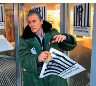
◀示威者在劍橋分析辦公室外張貼抗議海報

大型平台稱已設置了保護措施，比如用人工審核及自動掃描工具來偵測合作夥伴的數據濫用行為。但軟件專家稱，由於審查鬆懈，相關政策根本不起作用。如果嚴格追查，或許會限制建立在數據共享上的創新工具的供應。