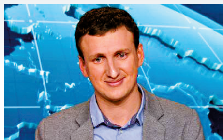
▲科根是Fb用戶資料泄露的源頭