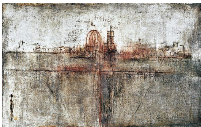
▲趙無極1951年的油畫《無題》，估價450萬至750萬港元