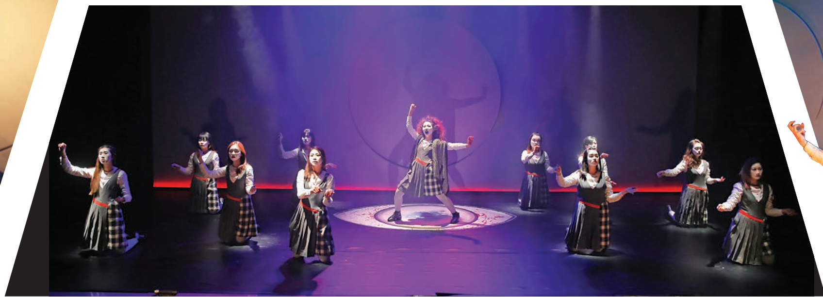
▶馬克白夫人@《馬克白》，所有守婦道的女人都是馬克白夫人