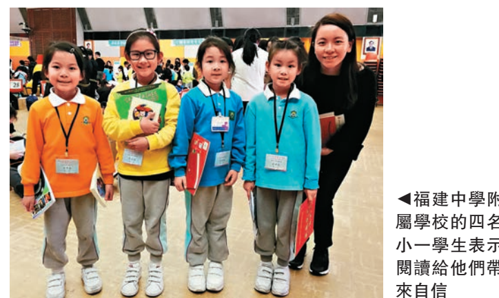
▲福建中學附屬學校的四名小一學生表示閱讀給他們帶來自信