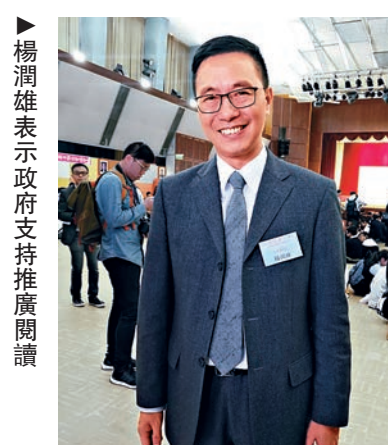
▶楊潤雄表示政府支持推廣閱讀