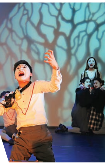
▲理察三世@《理察三世》，善即是善，惡即是惡，清清楚楚，一目了然