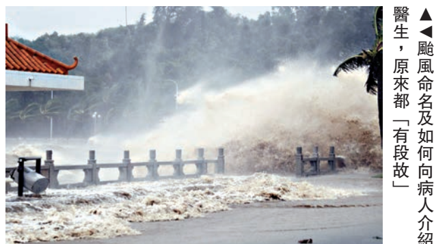
颶風命名及如何向病人介紹醫生，原來都「有段故」