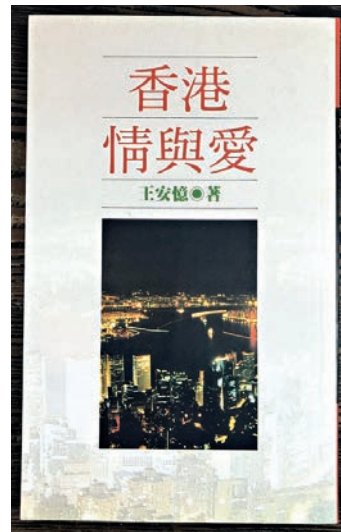
▲王安憶作品《香港情與愛》，寫於香港回歸的前四年

我很喜歡看王安憶的作品，其高超文學技巧，或許我難以體會，但就喜歡文字間溫婉訴說的感覺，平而不淡。她是上海人，很愛香港，寫過不少香港的人和事。1983年，她第一次訪港就寫過一篇散文叫《美麗香港》。我讀過有兩個中篇寫香港，一個是在回歸四年前（1993年）寫的《香港情與愛》，一個是在回歸20周年的2017年寫的《紅豆生南國》。