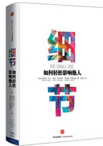
《細節》由三位作者合著。他們從生活及實驗中，提煉出不同細節對人們認知和心理的種種影響。