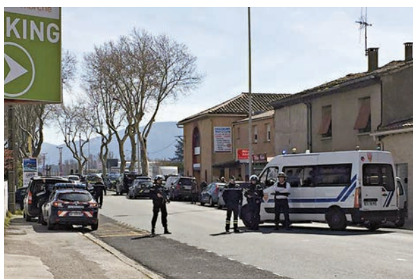
▲槍手犯案後被擊斃，反恐機構正調查案件