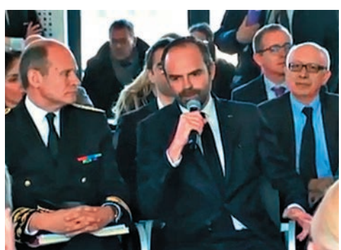
▲法國總理菲利普（中）證實案件為恐怖襲擊

事發後，法國總統馬克龍密切留意事態發展，並要求內政部長科隆前往槍擊案現場。總理菲利普說，此案情勢「嚴重」，並指所有線索都顯示這起事件為恐怖襲擊。法國《費加羅報》指，案發後法國國家憲兵特勤隊（GIGN）、國家警察黑豹突擊隊（RAID）和偵緝行動特勤組（BRI）均已抵達事發現場，並動用三架直升機。當地時間下午2時40分（本港晚9時40分）左右，警方以優勢警力攻堅將槍手擊斃，來自巴黎的反恐專家正調查事件。