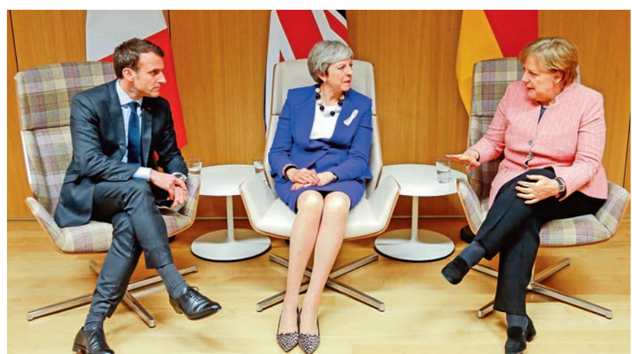
▲（從左至右）馬克龍、文翠珊、默克爾22日布魯塞爾會面

另外，本次峰會也確定，當英國明年三月底脫歐後，設立21個月的過渡期，其間英國會保留在歐盟單一市場及關稅同盟，但不能參與歐盟決策。