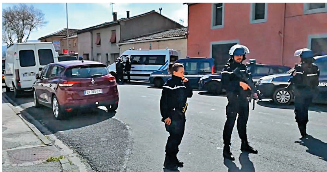
▲法國南部小鎮特雷布23日遭遇恐怖襲擊，警方封鎖現場