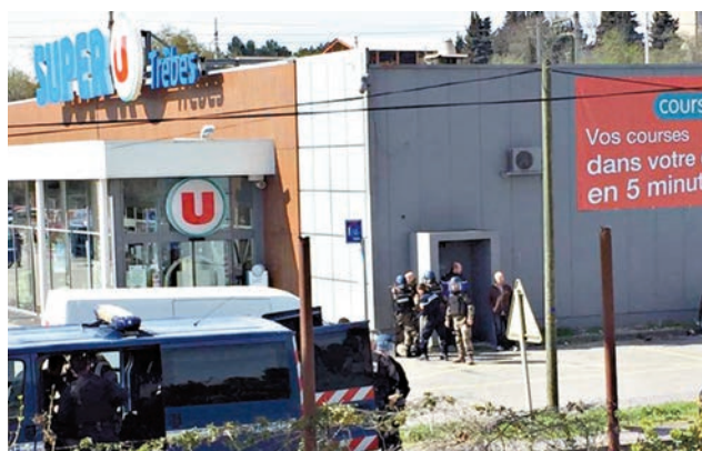
▲事發於特雷布一家Super U超市