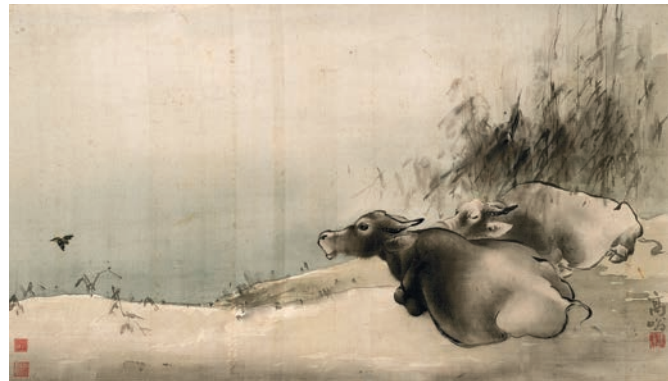
▲高奇峰作品《雙牛圖》