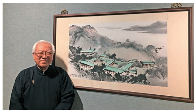
▲嶺南畫派第三代傳人歐豪年及其作品《崇基秀色》