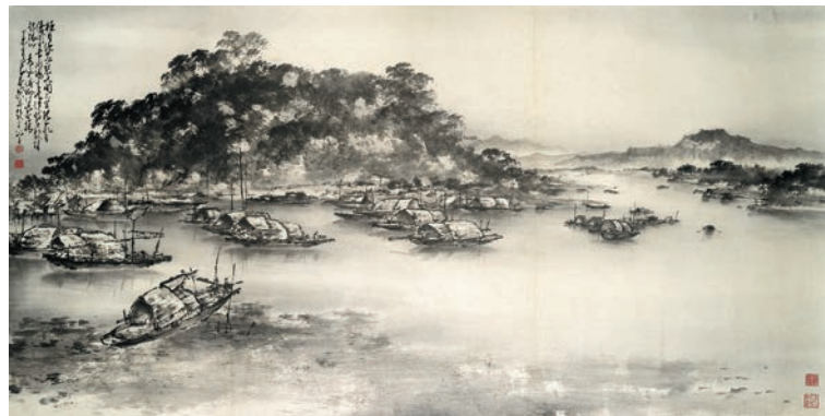
▲趙少昂作品《香港大埔坳山水》