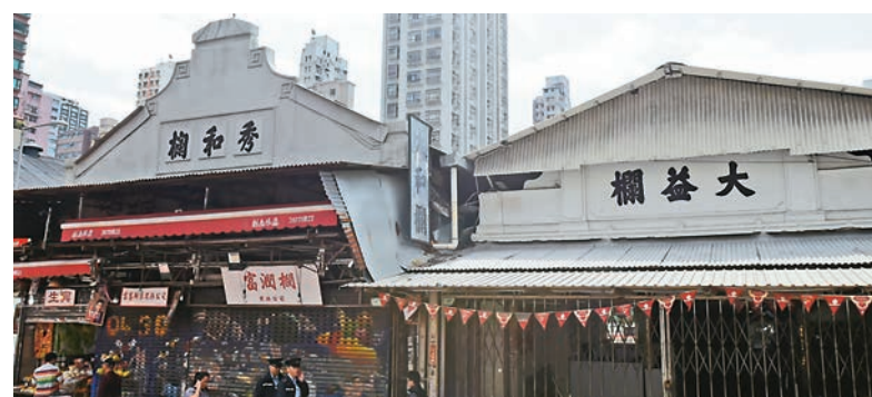
▲欄內一排掛掛鉤是早期出售香蕉時，將一把把焗好的香蕉懸掛供客選購