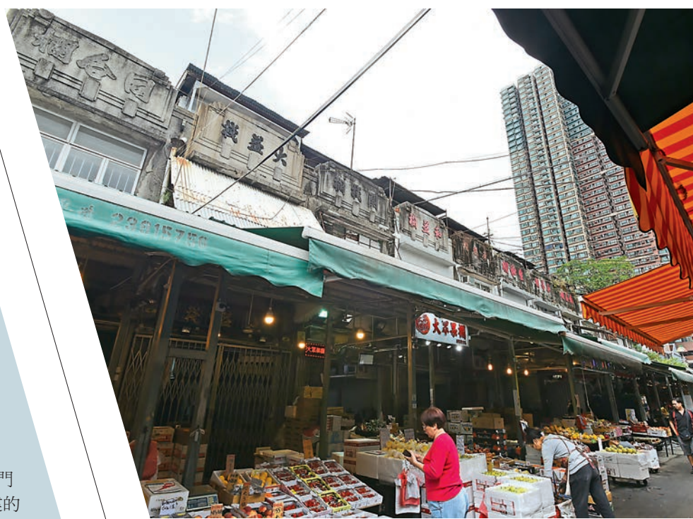
▲今日十六座二級歷史建築招牌不變，檔主加設簷篷做生果零售