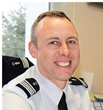
▲貝爾特拉姆在23日恐襲中殉職，終年45歲

【大公報訊】據英國廣播公司報道：法國南部小鎮23日發生恐怖襲擊，宣稱效忠極端組織「伊斯蘭國」(ISIS)的槍手一度挾持人質。事發時提出以自己交換人質，結果身中多槍的警官搶救無效死亡，總統馬克龍讚揚其盡忠職守。