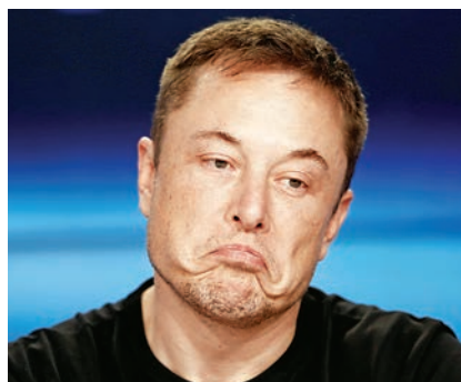
▲SpaceX創辦人兼行政總裁馬斯克