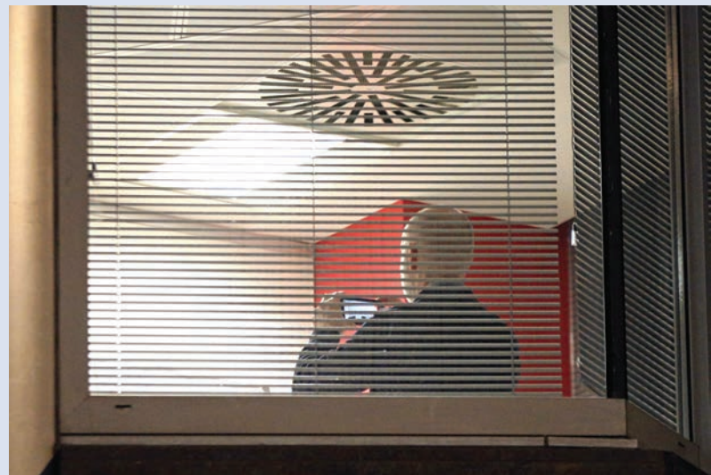
▲英國信息監管局執法人員錄像取證