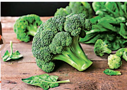
▲西蘭花是高纖蔬菜，不妨多吃

至於高纖飲食，在中國人的飲食習慣中，值得提醒大家一點：蔬菜的確含有纖維，但若論纖維量，中國人愛吃的生菜、白菜、菜心等其實纖維量偏低，高纖蔬菜有通菜、西蘭花、韭菜、芥蘭等；瓜類以絲瓜較高纖。其實，豆莢類的纖維量高出蔬菜數倍以上，如白豆、四季豆等，不妨多吃。在西方飲食文化，習慣餐前進食沙律，這對攝取纖維亦十分有效。