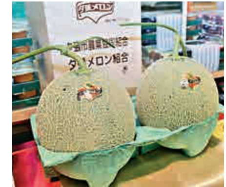
▲日本蜜瓜獨有甜度標籤

各地出產的蜜瓜外觀一樣，如何分辨呢？本地鮮果業老行尊「敦路」指，日本蜜瓜的出口量不多，連同運費後，售價一般要200至300元，如價格太便宜，未必是由日本出產。而且，日本出口的蜜瓜都有甜度標籤，其他地方出產的蜜瓜都無甜度標籤。