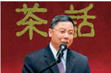
▲中國駐美公使李克新批評「台旅法」違反一中原則 中央社

【大公報訊】據中央社報道：中國駐美公使李克新表示，近來中美關係出現雜音，有人試圖打「台灣牌」抑制中國（大陸）發展。「台灣旅行法」違反一中原則與中美三個聯合公報，一中原則是兩岸與中美關係政治基礎，不容交易。