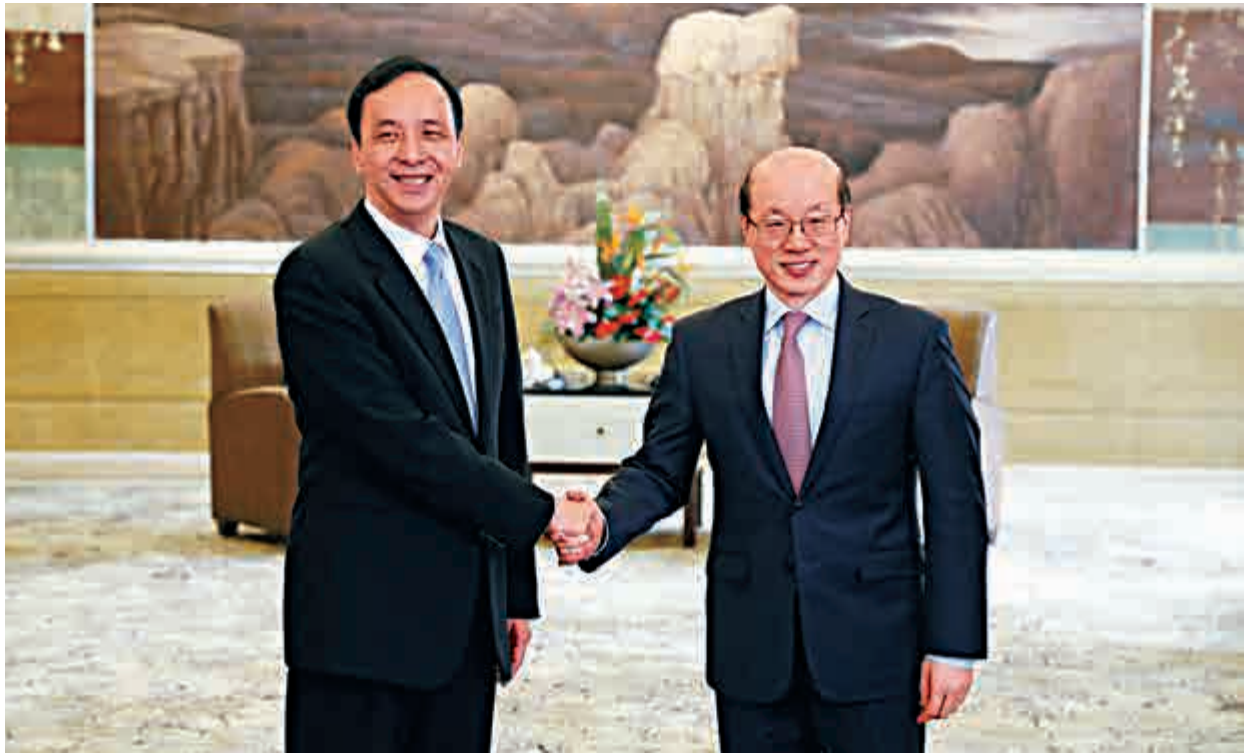
▲中共中央台灣工作辦公室、國務院台灣事務辦公室主任劉結一（右）二十六日在上海會見了台灣新北市市長朱立倫一行

劉結一說，這些政策範圍廣、力度大，受到了台胞們的歡迎。我們秉持「兩岸一家親」理念，願意率先同台灣同胞分享大陸發展的機遇，願意繼續推動兩岸交流與合作，向在大陸學習、創業、就業、生活的台灣同