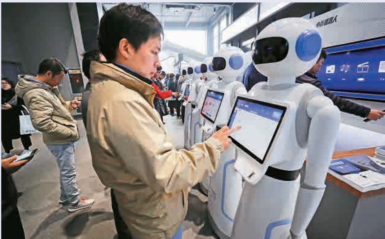
▲區塊鏈、大數據、物聯網、人工智慧和移動互聯網等新技術，正為經濟發展注入新動能、激發新活力。圖為民眾體驗人工智能機器人