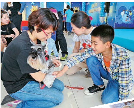
▲「狗醫生」幫助自閉症患兒