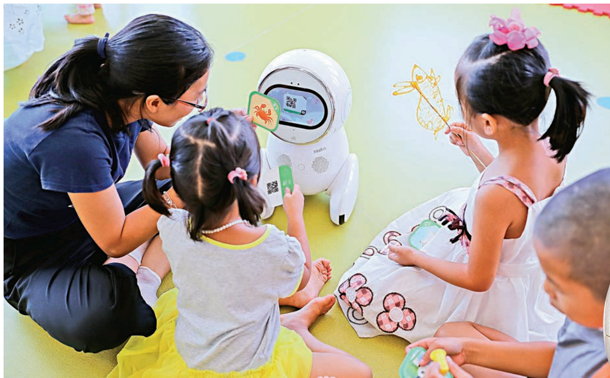
◀ KEEKO 機器人成為幼稚園老師的小助教