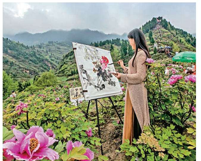
▲重慶墊江牡丹陸續綻放，四月迎最佳賞花期

與山東菏泽油牡丹、河南洛陽觀賞牡丹不同的是，墊江牡丹源於天然，藏於深山溝壑，其丹皮質量居全國之冠，有「墊丹」的美譽。其花形大、花姿美、花期長等特點，有太平紅、千層香等60多個品種，自然立體分布在山、水、石、林、雲、嵐間，渾然一體、相得益彰，是中國山水牡丹宗系的典型代表。春暖花開之時，遊客在墊江不僅可觀賞到雍容華貴的牡丹花，還可到五彩田園體驗農耕文化，親自磨一碗正宗的石磨豆花。