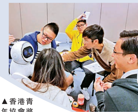
▲香港青年協會將 KEEKO 機器人引進香港市場開展培訓，合格學員頒發證書。圖為香港學員正在培訓使用 KEEKO 機器人