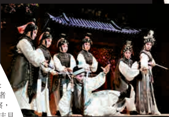
▲男主角在公主閨房中被發現，險死還生

在導演手法方面，眾所周知毛俊輝對於西方戲劇歷史和表演風格瞭如指掌。個人認為，在這齣「新浪潮」粵劇中，能夠看到了康斯坦丁·史坦尼斯拉夫斯基和貝托爾特·布萊希特這兩位戲劇家的影子。何解？首先，因為毛俊輝選擇了布萊希特的劇場手法來拉近觀眾距離。須知道，布萊希特提倡史詩劇場(Epic Theatre)主要是以藝術手段反映人類社會狀況，教育觀眾思考和批判劇中所示的問題，從而帶起社會變革。他的戲劇理論別樹一幟，有別於史坦尼斯拉夫斯基的表演方法和着重心理分析。布萊希特強調：人的行動轉變決定了事情怎樣發生、左右結局，並提醒觀眾要時刻理性思考，不應沉溺在感性的情節中，因此設計出不少獨特的舞台手法，如「疏離效果」、「敘述性」、「打破四面台」等等，對往後世界戲劇的發展影響深遠。這些劇場風格在《百花亭贈劍》裏不難發現，例如