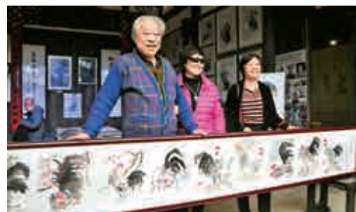
▲原福州市常務副市長龔雄(左一)向觀眾展示他的國畫《百吉圖》

【大公報訊】記者史兵福州報道：由福州市霞光書畫院、七閩畫院和福州市鼓樓區南街文化站共同舉辦的福州「萬家春風書畫展」，