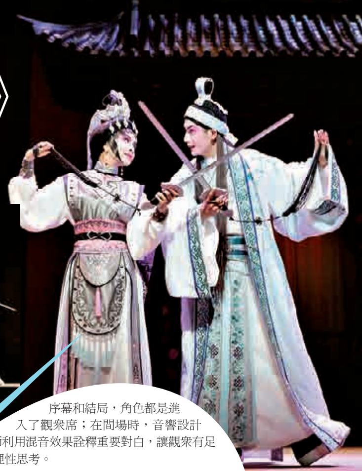
序幕和結局，角色都是進入了觀眾席；在間場時，音響設計師利用混音效果詮釋重要對白，讓觀眾有足夠的理性思考。