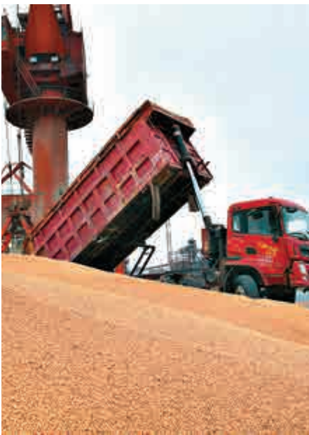
▲中國南通港口的工人正在處理進口大豆

龍洲經訊中國問題研究主管葛藝豪稱：「我感覺華府誇大看待這些關稅可能（對中國）帶來的痛苦。」 另一方面，中方認為，他們能夠利用美國政治體系弱點。北京大學經濟學教授王勇說，中方可能的報復關稅之所以鎖定大豆等農產品，因為「美國農業在國會有相當程度影響力。中國想讓美國國內政治體系自行反制。」對於美國大豆農民和農民代表組織公開反對特朗普政府的關稅計劃，朱光耀便表示感謝。 再從全球來看，葛藝豪稱，美國要對抗中國，團結一致比單打獨鬥更有效，但特朗普至今仍未辦法組成聯合陣線。中國國家主席習近平向世界展現的，是中國慎重捍衛從全球貿易到氣候變遷等國際性協議，而特朗普則一直想退出這些協議。