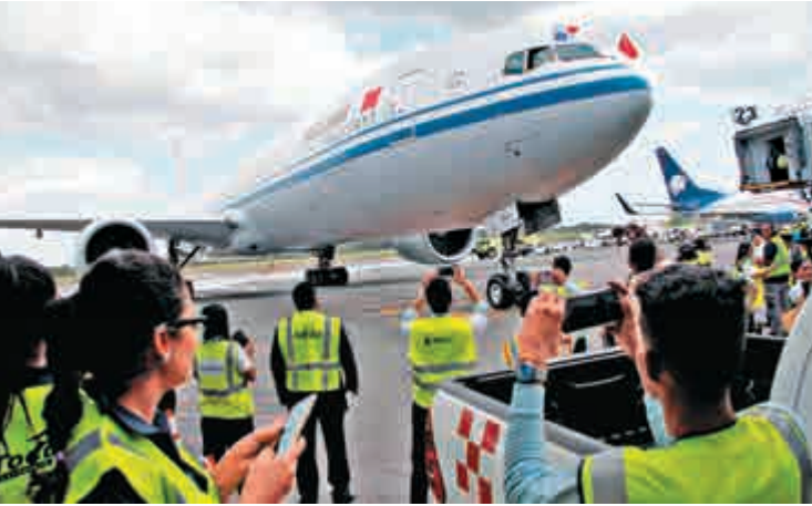
▲美國波音公司一架777客機5日抵達巴拿馬

【大公報訊】據美國《華爾街日報》報道：美國波音公司周三表示，將與美國和中國政府展開對話，希望阻止中美貿易爭端對全球航空業造成損害。波音在聲明中表示，在近期中美領導人保證正進行富有成效的會談基礎上，該公司將繼續主動與兩國政府進行接觸。 波音飛機出現在中國政府最新公布的關稅清單中，但僅限於空載重量在1.5萬至4.5萬公斤之間的較小型飛機。分析師表示，這些關稅將影響現有單通道主力波音737機型，以及最小型737 Max替代機型。這些機型在波音737積壓訂單中的總佔比僅為5%。 中國是波音最大單一市場，