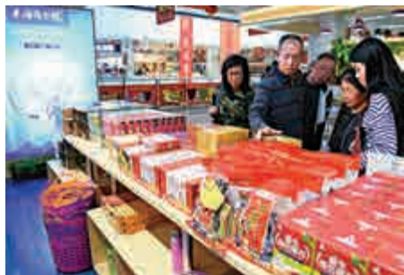
▲顧客在福建平潭台灣商品免稅市場選購台灣商品 資料圖片

【大公报訊】據中新社報道：作爲最新試點合格境外投資者（QFLP）政策的自貿區，福建省平潭綜合實驗區推出多項優惠新政，其間對台資台商優惠力度尤其吸引外界關注。平潭綜合實驗區金融辦副主任楊哲安7日接受中新社記者專訪時指出，這是平潭對「惠台31條」的執行落實