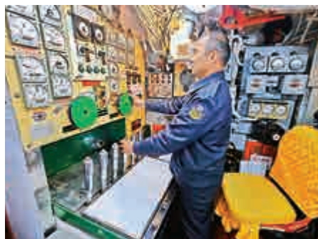
▲目前台軍的海豹潛艇為世界上服役時間最久之現役潛艇 資料圖片

據了解，台灣潛艇自造所需零部件分為「紅區」、「黃區」、「綠區」三類：「紅區」為台灣尚無研製能力，須尋求他方援助的技術，包括潛望鏡、柴油主機、