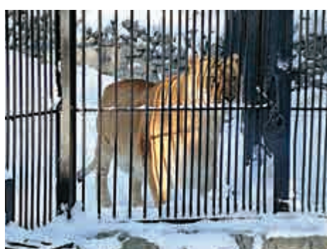
▲獅虎是獅子與老虎的混種

附近還有另外兩座木屋。黃色的孔雀屋（Peacock House），設計同樣精緻獨特。仔細去看，更能看到木屋雕琢的精緻細微，盡顯建築師的精心設計。而巨龍屋（Dragon House）的外面，更有條小木龍從屋簷下探頭而出。