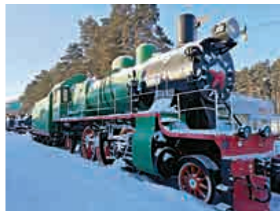
▲西伯利亞西部鐵路歷史博物館展示的火車頭