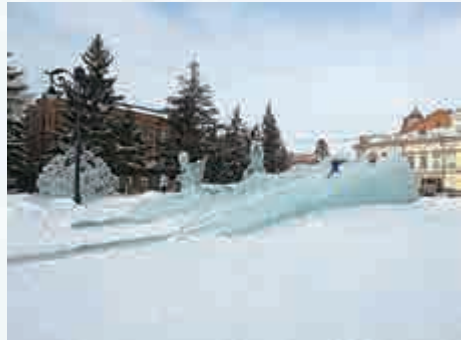
▲冰製滑梯讓人重拾童真

新西伯利亞最著名的標誌可算是它的火車站。這座以鐵路立城的城市，可想而知，火車對它的重要性。這裏是西伯利亞