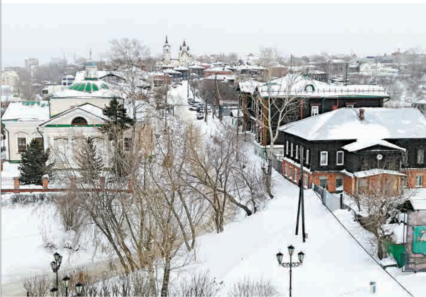
▲登上歷史博物館頂層的瞭望塔，俯瞰托木斯克市

今時今日，踏足西伯利亞不一定要從莫斯科坐上好幾天火車才能到達。有了直航航班，從香港直航新西伯利亞，七小時左右便到達。西伯利亞皚皚白雪的冬季景色，特別美麗，氣溫一般在攝氏零下十五至二十五度左右。但只要做足禦寒措施，其實在街上走動還是可以的。今次旅程到訪了兩個地方，新西伯利亞（Novosibirsk）及托木斯克（Tomsk）。兩個地方之間需要乘坐四小時左右的火車旅程。