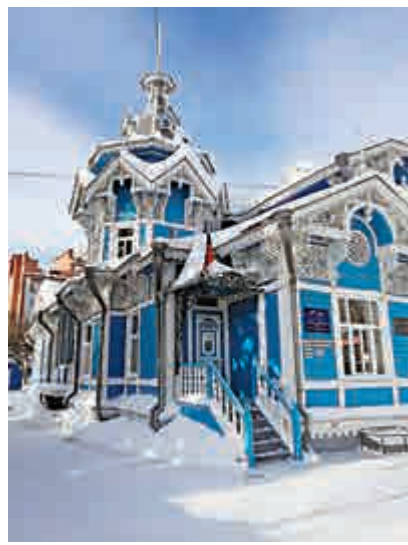
▲德裔俄人屋以藍色作主調，非常吸睛