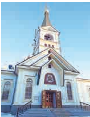
▲升天大教堂於一九八八年重建