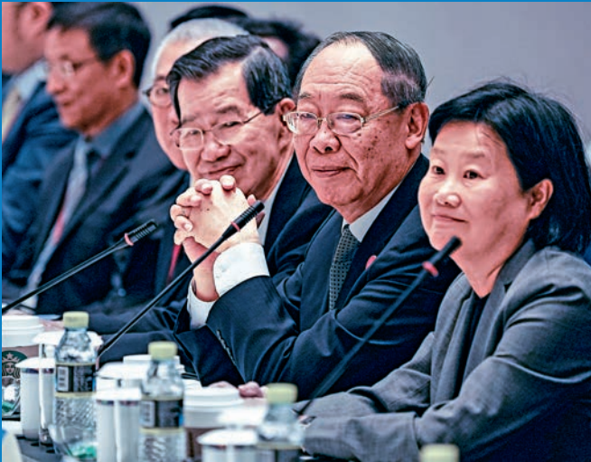
▲今年兩岸企業家圓桌會議以「新時期擴大兩岸經濟合作的路徑和方向」為主題