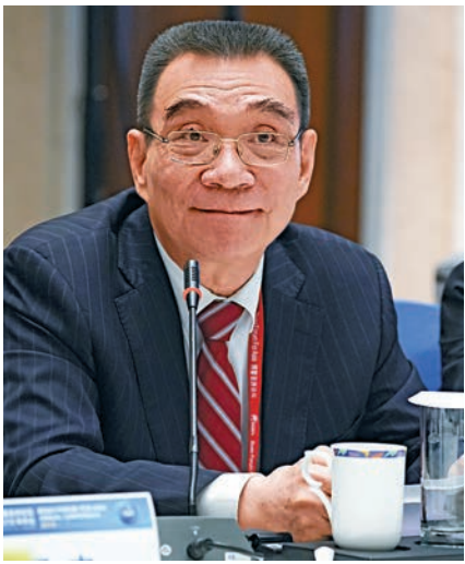
▲北京大學新結構經濟學研究院院長林毅夫出席兩岸企業家圓桌會

商務部外國投資管理司副司長朱冰在會上表示，大陸有能力有條件實現更高質量、更有效率、更加公平、更加持續的發展，強調優先同台灣同胞分享大