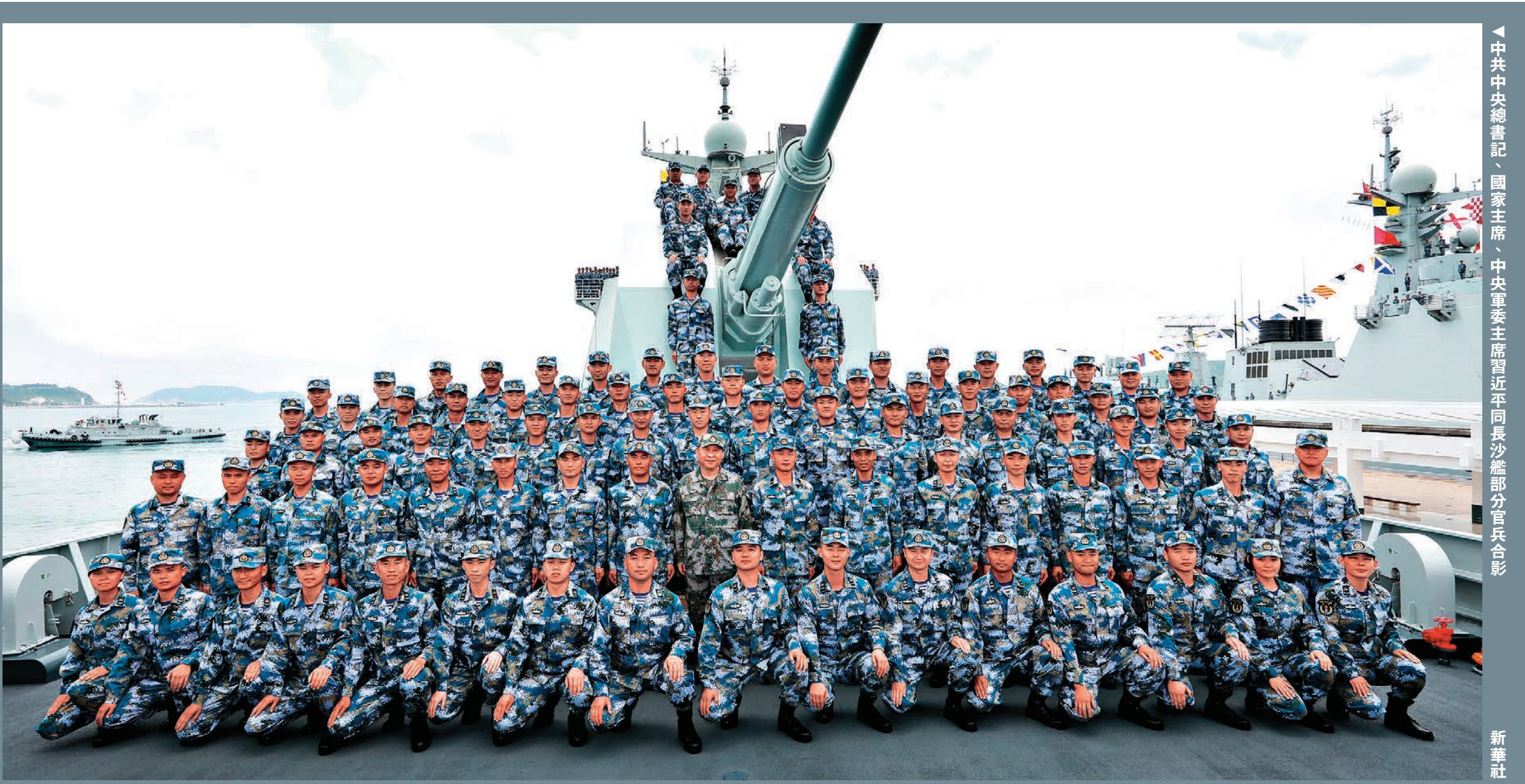
中共中央總書記、國家主席、中央軍委主席習近平同長沙艦部分官兵合影。