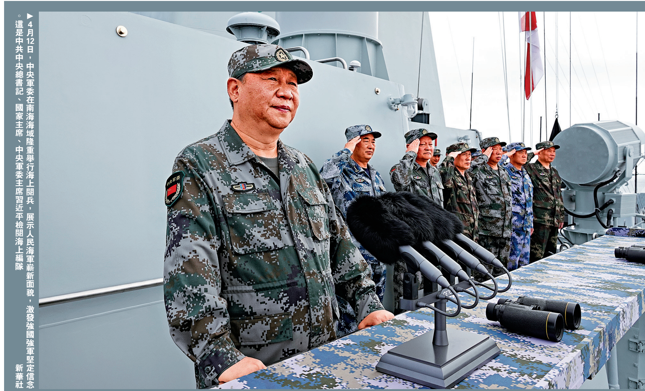
4月12日，中央軍委在南海海域隆重舉行海上閱兵，展示人民海軍新面貌，激發強國強軍堅定信念。這是中共中央總書記、國家主席、中央軍委主席習近平檢閱海上編隊。