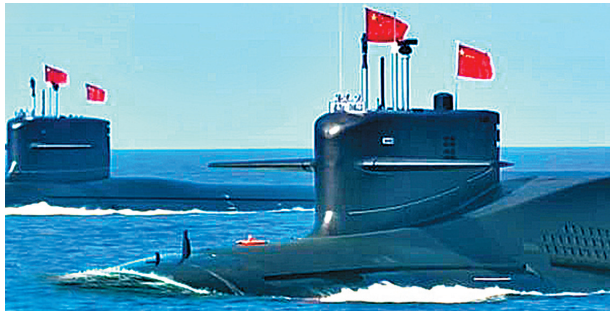
▲新型核潛艇及常規動力潛艇集體亮相