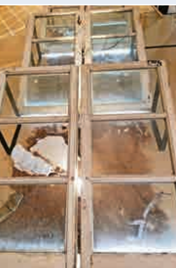
▲透過一扇扇的殘舊窗框外觀內望，是三十五年來藝穗會遺留的門鉸、螺絲釘等「碎屑」，交織着裏外今昔的回憶印記

註：「格外地創：藝穗會的故事」展覽，現正在中環下亞厘畢道2號藝穗會展出，至四月三十日結束。