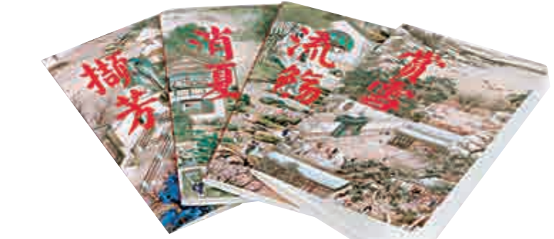
▲故宮博物院的十二月行樂筆記本 資料圖片