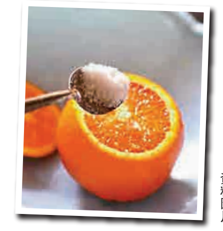
▲鹽蒸橙子是老幼皆宜的止咳偏方