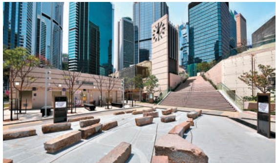
▲夏慤花園展示了29件19世紀殘存海堤遺跡的花崗石

中西區上班族注意！想午飯時段搵個「鬧市綠洲」用膳歇息？「全新」夏慤花園不失爲好去處！爲配合港鐵沙中線興建工程而原址重置的夏慤花園，昨日起重新開放，園內「文青味」十足。