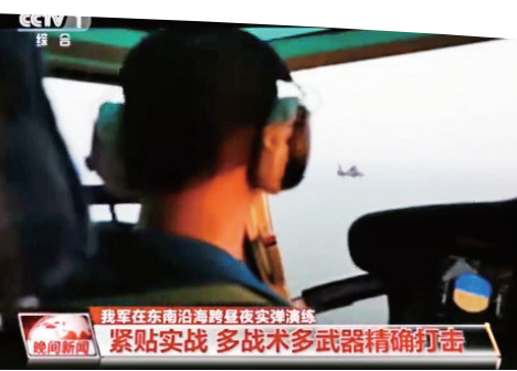
▲直升機進行偵察搜索