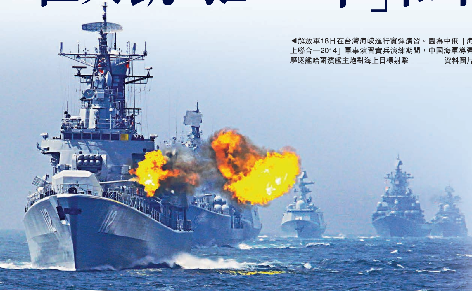
◀解放軍18日在台灣海峽進行實彈演習。圖為中俄「海上聯合—2014」軍事演習實兵演練期間，中國海軍導彈驅逐艦哈爾濱艦主炮對海上目標射擊 資料圖片