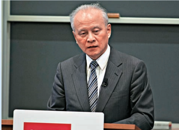
◀當地時間4月17日，中國駐美大使崔天凱在美國哈佛大學發表演講 中新社

解放軍18日在台灣海峽進行實彈射擊軍事演習，內地媒體根據公布的經緯度製作的演習地點地圖顯示，演習海域位於福建泉州的東南方向，距離金門約65公里。對於此次演習對外傳遞出的信息，中國駐美國大使崔天凱17日在答問時說：「中國堅決捍衛領土主權完整，會繼續堅持防禦型的國防政策。我們當然最終會統一，我們仍希望和平統一，但如果有人試圖把台灣從中國分離出去，那我們將盡一切可能保存領土和主權完整。」崔天凱強調，台灣問題事關中國核心利益，「一中原則」是和平解決方案的基礎，中方沒有妥協餘地。