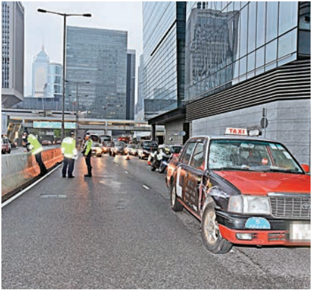
▲中區夏慤道的士撞斃過路男子現場

約30歲、深色皮膚，蓄短黑髮的男子，從路中約一米高的石墜跳下，橫過馬路，周收掣不及，撞到該男子，男子被撞上擋風玻璃，再飛彈五米遠，頭部重傷昏迷地上，現場遺下20米長的煞車呔痕。周姓司機被玻璃碎片割傷，要送院。警方調查後，以涉嫌危險駕駛引致他人死亡拘捕的士司機。港島總區交通部特別調查隊正調查案件，並呼籲任何人如目睹意外發生或有資料提供，請致電3660 6848或3660 6849與調查人員聯絡。