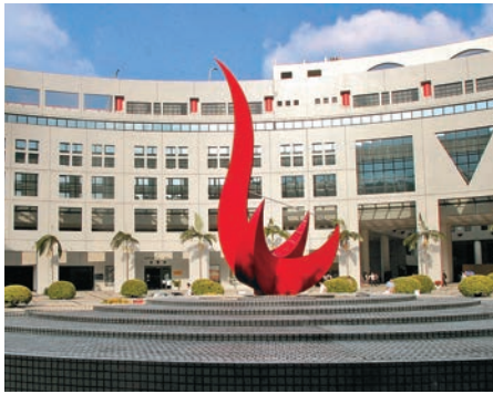
▲香港科技大學學生宿舍，過去一周發生兩宗女生沖涼時被偷拍事件 資料圖片

【大公報訊】突發專題組報道：香港科技大學學生宿舍，過去一周發生兩宗女生沖涼時被偷拍事件。其中一名19歲女生，前日凌晨在宿舍的浴室兼更衣室內沐浴時，發現遭人用手機偷拍，女生大叫火速穿回衣服追出，惟色狼已逃去無蹤。 據悉，科大學生宿舍要以學生證拍卡進入，浴室大門設有密碼鎖，只供該樓層的學生使用。科大學生宿舍過往亦發生過同類偷拍事件，2014年5月，一名19歲女生在本科宿舍浴室沐浴時，發現被一名男子以手機偷拍，對方被女生大呼嚇退。2013年7月，本科宿舍第五座一名20歲內地女生