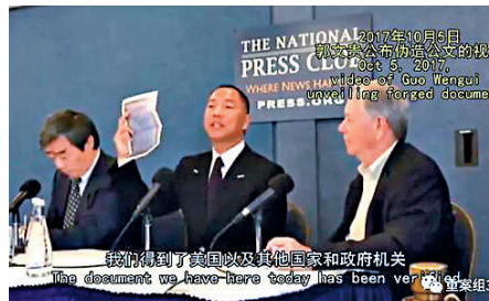
▲2017年10月，郭文貴公布偽造文件

密成圖片格式，如轉換成一朵花、一種動物等圖案進行傳送，陳志煜收到後通過解密程序直接獲取裏面的內容。