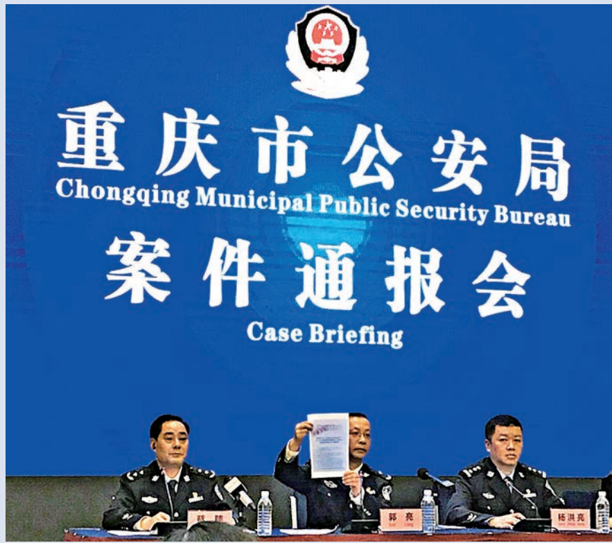
▲重慶市公安局23日召開案件通報會