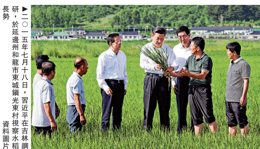
▲二〇一五年七月十八日，習近平在吉林省長勢，於延邊州和龍市東城鎮光東村視察水稻 資料圖片