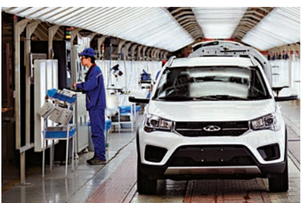
▲奇瑞汽車鄂爾多斯分公司員工在先進的總裝車間工作

會議強調，要加強黨的集中統一領導，沿邊沿海各級黨委要落實主體責任，抓好黨的邊海防方針政策貫徹落實，完善集中統一領導的制度機制，強化重大工作的頂層設計、總體布局、協調推進，切實將各方面各領域力量融起來、工作統起來。要強化統籌協調、健全制度機制、搞好齊抓共管、推進依法治邊，進一步完善邊海防力量體系，走開軍民融合共建邊海防的路子，推動軍地聯防聯管，落實相關保障措。