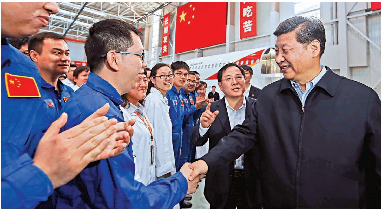
▲二〇一四年五月二十三日，中共中央總書記、國家主席、中央軍委主席習近平在上海中國商飛設計研發中心綜合試驗大廳與試飛工程師親切握手