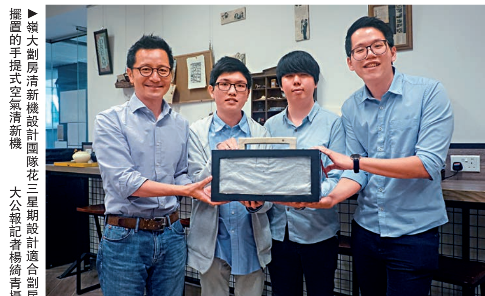
▲嶺南大學學生展示割房清新機

【大公報訊】記者楊綺青報導：無窗割房空氣零流通，隨時影響健康。嶺南大學三名學生自組「割房清新機設計團隊」，花三星期設計一部適合割房擺置的手提式空氣清新機，機身細細，但內藏四個電腦風扇，並設有活性炭過濾網，吸走空氣中的污染物，持續使用50小時才用到一度電，淨化空氣同時節省電源。