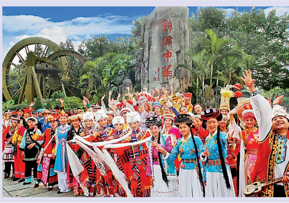
錦繡中華和中國民俗文化村由中旅創建