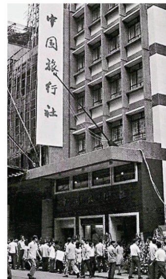
一九二八年，首家中國旅行社香港分社選址皇后大道中6號