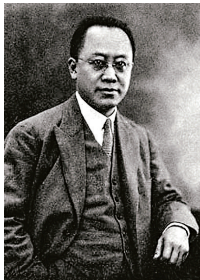
二十年代，時任上海商業儲蓄銀行總行總經理的陳光甫將旅行部從銀行分拆，改名為中國旅行社