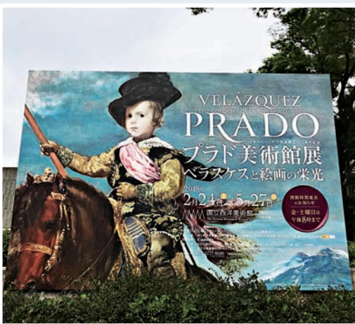
▲東京國立西洋美術館正舉辦普拉多精品展

反觀國立新美術館的布爾勒藏品展，所展出的則是以生於一八九〇年的德國實業家E.G.布爾勒先生的私人收藏。布爾勒先生生前酷愛藝術，其私藏囊括中世紀藝術和古典大師畫作，以及享譽全世界的印象派收藏。他本人百分之七十五的藝術收藏都在二戰之後的一九五至一九五六年完成，其中最富盛名的雷諾阿《艾琳·卡亨·安德維普小姐畫像》更是被作為此次特展的宣傳海報，日本人將小艾琳譽為「繪畫史上最強的美少女」，如此霸氣的廣告語加上日本藝術愛好者對