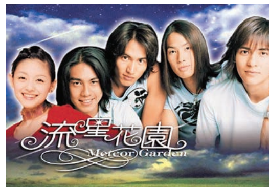
▲電視劇《流星花園》被視為偶像劇鼻祖

時光荏苒，不管是《流星花園》還是那一場流星雨，十七年前的那個夏天，它們帶給我的震撼和雋永，讓我始終朝着美好的方向在生活中奔跑。因此，我深刻地明白，經典就是經典，無論它是否有缺陷，它也將是難以超越的，畢竟，時光和記憶都會給它打上滿滿的情感分。