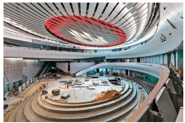
興建中的戲曲中心