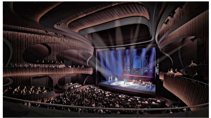
戲曲中心大劇場設計模型