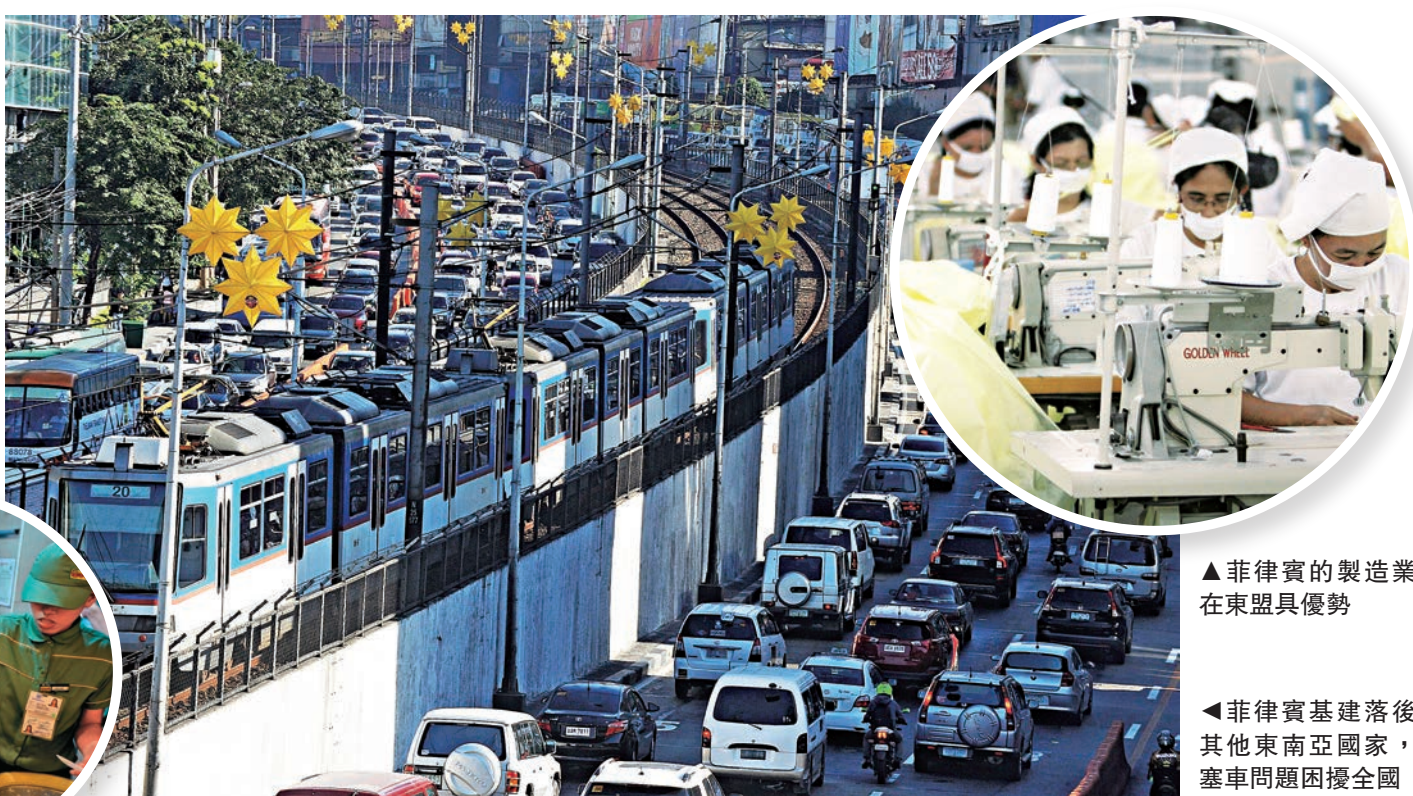
▲菲律賓的製造業在東盟具優勢