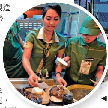
◀菲律賓人口年輕化

曾多次來港的施蒂絲表示，對香港美食有深刻印象，港人若到當地投資，首選應為飲食業，在當地經營香港餐飲，成功立竿見影。但她提醒，當地不同地方政府有不同法規，外商投資前要先了解清楚。