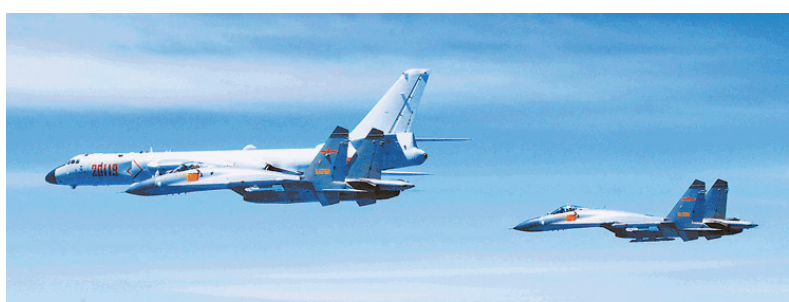
▲4月26日，空軍出動轟-6K等多型多架戰機繞飛台灣

軍事專家杜文龍指，「繞島巡航」體現了空軍的體系化作戰能力、地空保障能力和隨時能戰的能力，同時也檢驗了新機型的作戰能力。未來殲-20、蘇-35等機型都可能加入「繞島巡航」隊伍，體系化作戰的要素也會越來越豐富。