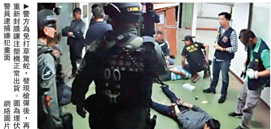
▲警方為免打草驚蛇，發現槍械後，重新封膜讓注塑機正常出貨。圖為埋伏警員逮捕嫌犯畫面

經鑒驗發現，109支槍支包括制式短槍102支、制式長槍5支、制式衝鋒槍1支、制式霰彈槍1支，分屬13國、32種廠牌，為近年最大一批制式槍支，數量驚人，辦案人員憂心的說「足以組織一連軍隊」。當中有82支槍槍號磨損，未標示來源。