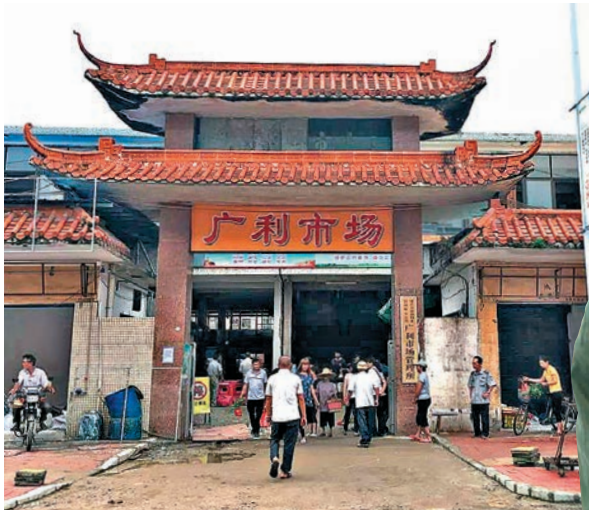
▲今天的廣利變化太大，已很難想像父輩離鄉時的模樣

蕭國健說，日軍佔領香港時，不少人逃返內地，香港人口從1941年約160萬人，減至1945年約50多萬人。直至香港「重光」後，進入上世紀60年代至70年代的經濟快速增長期，才再次吸引大批內地人來港。可是，由於漫長戰亂和社會動盪，不少來港的內地人，因家鄉已人去樓空，或慘遭戰火蹂躪等原因，與鄉親斷絕聯繫，甚至一生沒再返鄉，其後代已不懂根在何方。