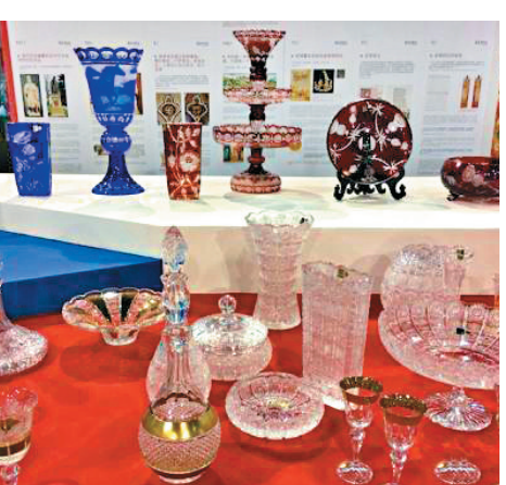
▲捷克國家館展出的水晶製品 網絡圖片

」圖片展等經貿文化活動，以呈現捷克這一中歐古國的非凡魅力。據捷克波丹妮展區相關負責人介紹，這一系列捷克的天然花果手工藝是他們此次參展的主打產品，其製作技術悠久，此次特地帶到義烏參展，希望借助本屆展會進一步提升品牌知名度，打開中國市場。「中國市場正處於上升期，對進口產品的需求也在增長，我們對中國市場抱有很高的期望。」該負責人說道。 據悉，義烏進口商品博覽會已成功舉辦三屆，累計吸引了5000多家國外企業和數以萬計的進口貿易商前來參展參會，為境外中小企業源頭產品進入中國市場創造了良好的貿易契機。