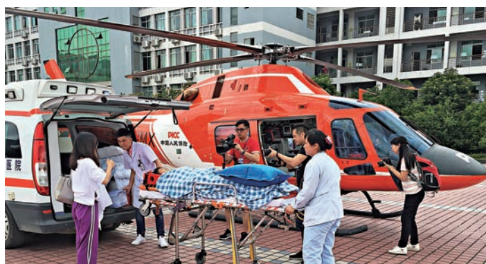
▲醫院出車接駁，運送49歲心梗病人登機