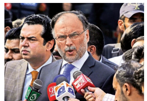
▲去年10月，伊克巴爾在伊斯蘭馬巴德對記者發表談話

中要求嚴懲褻瀆宗教的人。而此次調查人員指出，兇徒正是受到去年宗教褻瀆爭議的啟發，決定開槍射擊伊克巴爾。