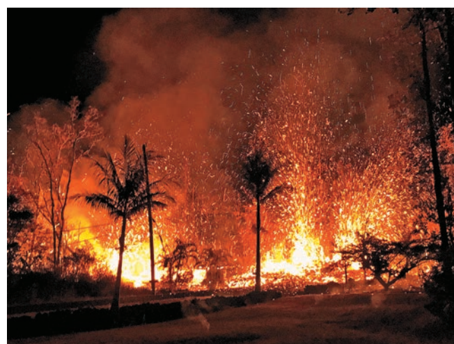
▲5日，夏威夷大島東部樂蘭尼區岩漿噴發超過70米