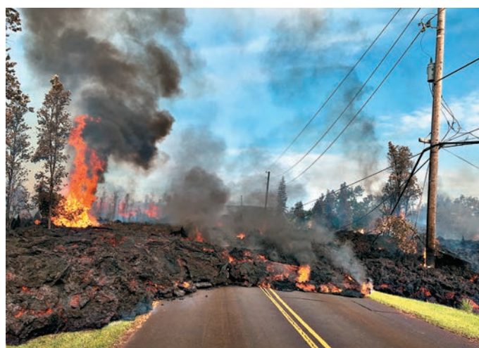
▲夏威夷活火山基拉韋厄火山爆發，熔岩流到公路，不斷噴出石塊、毒氣和蒸氣