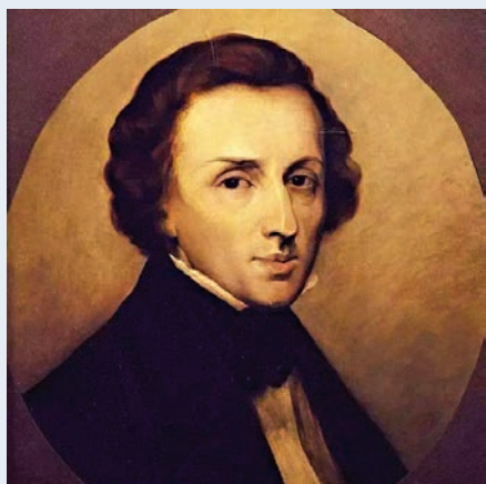
◀蕭邦肖像 資料圖片

思考？在憂鬱？在苦悶？他的眼睛似睜非睜，似閉非閉；他一臉無情，彷彿無思、無慮、無憂？蕭邦在這狂風掠面之晨孤零零地坐在樹之下究竟在想什麼？憂什麼？恨什麼？我越看那張生動、朝氣、天才、漂亮的臉，越覺得他和中國的洗星海怎麼那麼像，讓我驚訝的是洗星海死了，許多人都對那張年輕充滿才氣的臉變得陌生起來，而蕭邦不是，波蘭人無時無刻不在懷念那位天才的年輕人，我回過頭一看，蕭邦肖像的周圍無聲地坐滿了人，有白髮蒼蒼的歲月老人，也有天真幼稚的兒童，在津基公園蕭邦雕塑的階梯石台階上滿滿地坐着數不清的人，波蘭人心目中的蕭邦，波蘭的蕭邦。