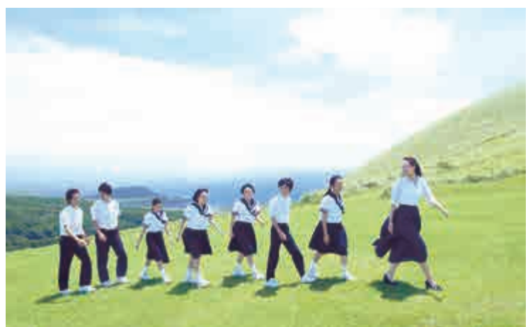
▲《再會吧！青春小鳥》屬青春校園電影，除了描述校園生活外，亦透過學生自身故事，談論不同社會議題

故事屬於青春校園電影，當中除了描述校園生活外，亦透過學生的自身故事，談論到不同的社會議題，旨在引發觀者思考，同時帶出無論遇到再大的挫折，都要勇敢地克服它的思想。