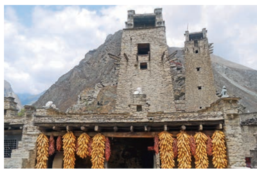
▲汶川大地震後的桃坪羌寨

汶川大地震後，位於四川阿壩州的羌族主要聚居地頃刻間成了廢墟，1/3的羌族人和數十位羌族文化傳承人罹難，大批珍貴的文物資料也被掩埋在廢墟之下，羌文化遭到毀滅性打擊。「搶救羌族文化」的口號被提了出來，人們開始努力，嘗試讓這個古老民族留下更多的印跡。10年光陰，當初的口號化作了林立的羌族建築，羌繡、羌笛等一批文化項目被搶救下來，並在傳承中創新。