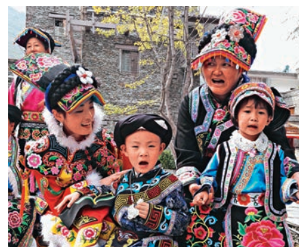
▲羌族文化亟需在年輕一代延續

然而，眾多的波折也沒有擊垮這位年輕的傳承人，如今她依舊在傳播羌繡的第一線奮戰。「我最希望的是把羌繡傳承下去，讓羌繡走向世界。」