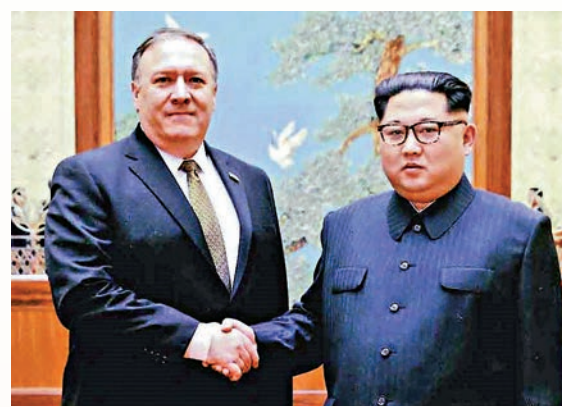
▲蓬佩奧（左）上月26日訪朝，與金正恩會面

特朗普該則推文寫道：「我很高興地通知各位，國務卿蓬佩奧和這3位很棒的男士一同搭機從朝鮮返國，大家都期盼見到這3人。他們看起來健康狀態良好。」國務院發言人指，3人能自行步上飛機。