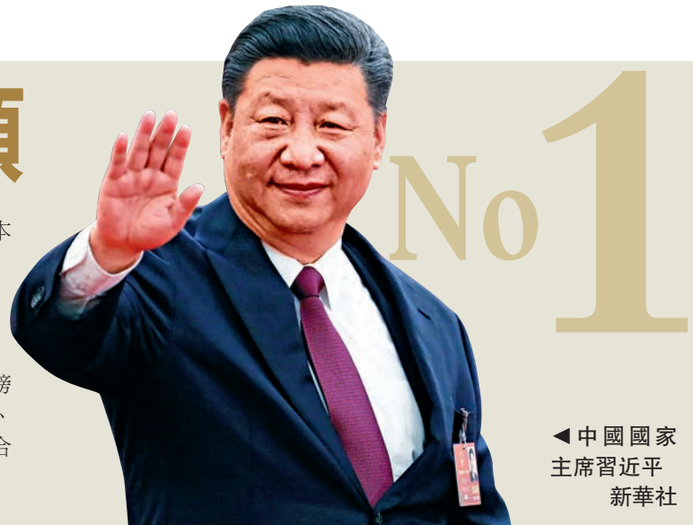
◀ 中國國家主席習近平 新華社

【大公報訊】據《福布斯》雜誌報導：美國《福布斯》雜誌（Forbes）9日公布了2018年全球最具權力人物榜，中國國家主席習近平力壓連續四年居首的俄羅斯總統普京，首登榜首。