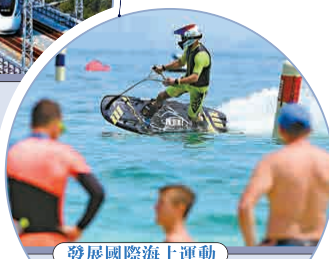
發展國際海上運動