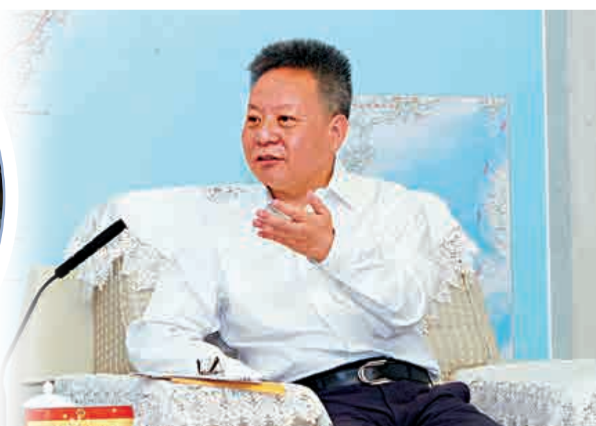
▲10日下午，海南省省長沈曉明會見香港媒體高層海南訪問團時表示，海南當前正大力推進自貿區（港）建設，這有利於深化瓊港合作