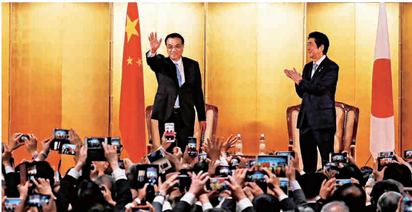
▲10日，日本經濟界在東京舉行活動，歡迎國務院總理李克強訪日和紀念中日和平友好條約締結40周年。李克強由日本首相安倍晉三陪同出席活動