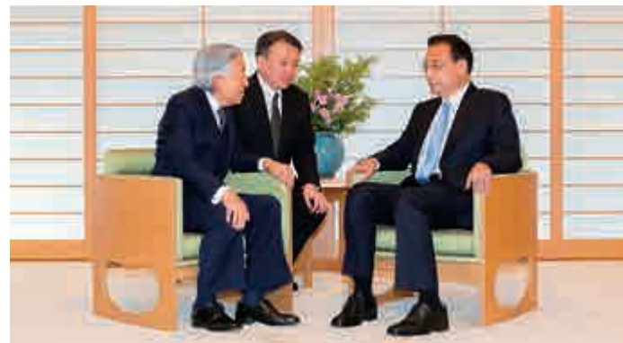
▲10日上午，國務院總理李克強在東京皇宮會見日本天皇明仁

9日中午，李克強於第六屆中日韓工商峰會上表示，我們願意加強中國「世界一流大學和一流學科」建設與日本「超級國際化大學計劃」、韓國「世界一流大學建設計劃」對接，舉辦「中日韓青年創客大賽」。中方願與日韓加強「銀髮經濟」合作，加強體育產業合作，促進「奧運經濟」發展。