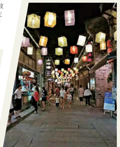
▲南塘老街是寧波地道小吃聚集地，人氣頗旺