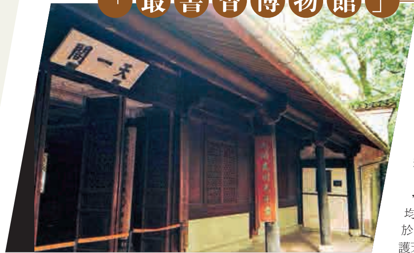
▲明代藏書樓——天一閣藏書樓