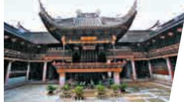
▲天一閣博物館內氣勢恢宏建於民國初期的戲台