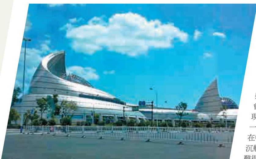
▲中國港口博物館如海螺座立東海之濱

▼中國港口博物館古代帶鉤展重點展品——戰國伏羲形純銀貼金帶鉤