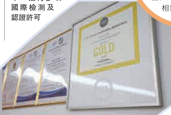
◀檢測服務專業獨立，涉及多台精密儀器