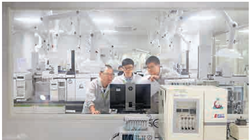
◀內地檢測中心近兩年大幅增加，內地科專才供不應求